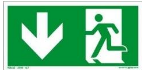
6. ábra Menekülési útirányt jelölő

A menekülési útirány jelzésére az előírt menekülési útvonalon a megfelelő irányba mutató jelzéseket kell alkalmazni. A 6. ábra csak a menekülési útirány jelzésére alkalmas tábla egy minta, amelynek típusát a konkrét menekülési útirányoknak megfelelően kell meghatározni.