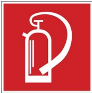
3. ábra Tűzoltó készüléket jelölő piktogramm jelölő piktogramm

A tűzoltó készüléket a 3. ábrán látható piktogrammal kell megjelölni, melynek felhelyezési magassága a 2. ábrán látható.