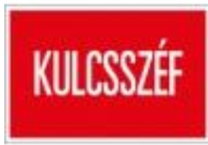
5. ábra Tűzoltósági kulcsszéfet jelölő piktogramm tábla